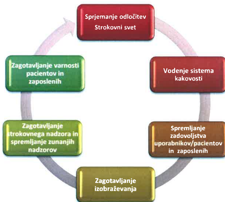
Slika 1: Planiranje in doseganje strokovne učinkovitosti kakovosti in varnost

Izboljševanje strokovne učinkovitosti, kakovosti in varnosti je eden glavnih ciljev, ki zajema vsa področja delovanja bolnišnice in širše.