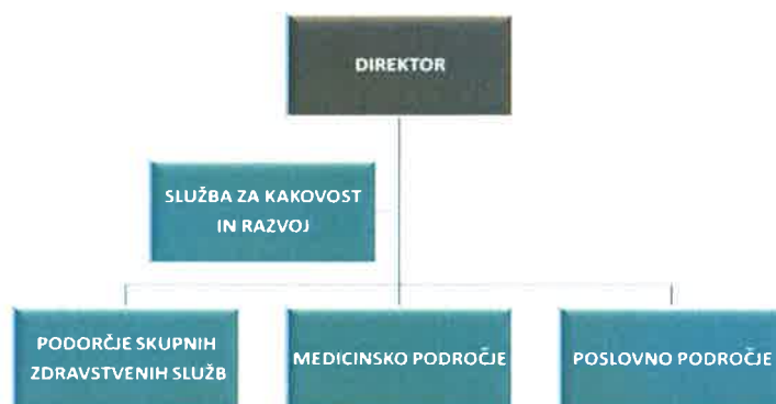
Slika 1: Osnovna organizacijska struktura PBB